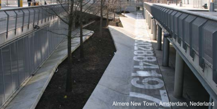
Almere New Town, Amsterdam, Nederland