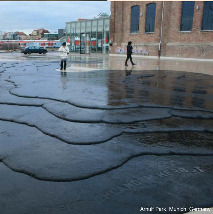
Arnulf Park, Munich, Germany