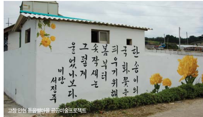
고창 안현 돌음별마을 공공미술프로젝트