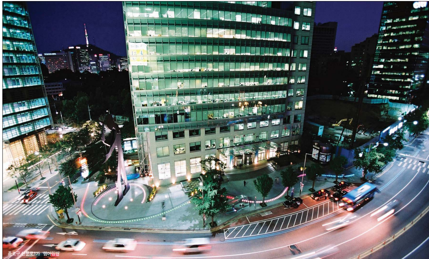
종로구 신문로1가 햄머링맨