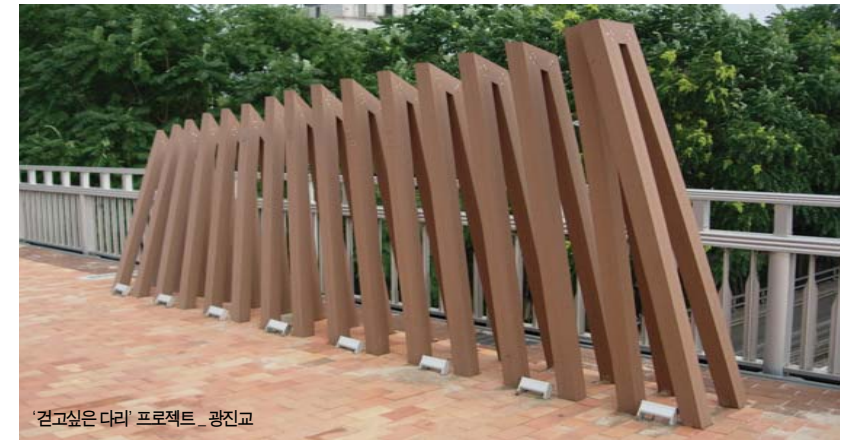
견고싶은 다리 프로젝트 - 광진교