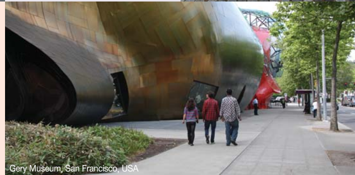
Gery Museum, San Francisco, USA