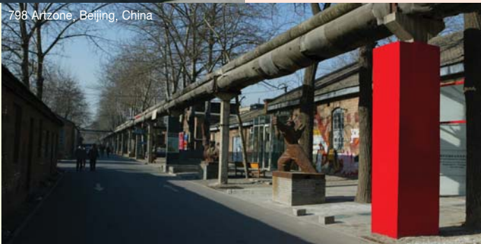
798 Artzone, Beijing, China