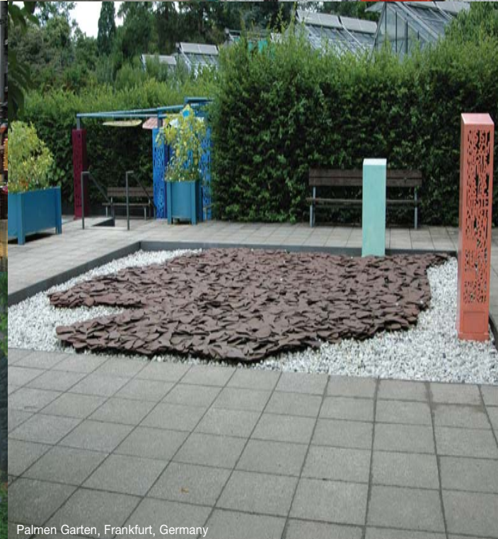
Palmen Garten, Frankfurt, Germany