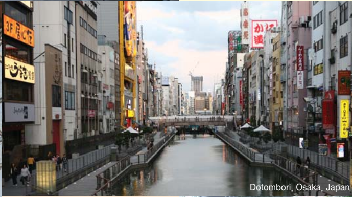
Dotombori, Osaka, Japan