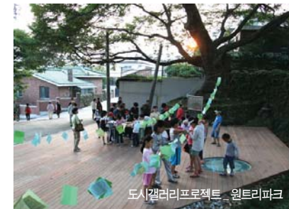
도시갤러리프로젝트 - 윌트리파크