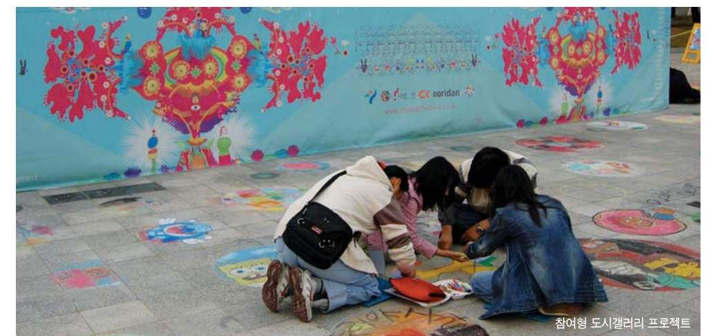
참여형 도시갤러리 프로젝트