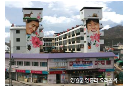
영월군 영흥리 요리박물관