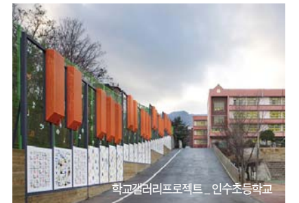
학교갤러리프로젝트 - 인수초등학교