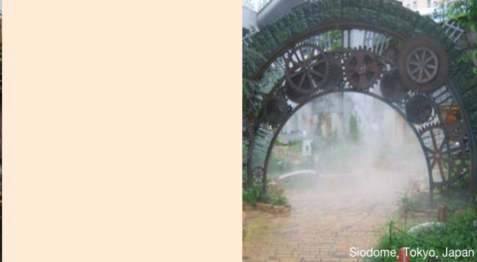
Siodome, Tokyo, Japan