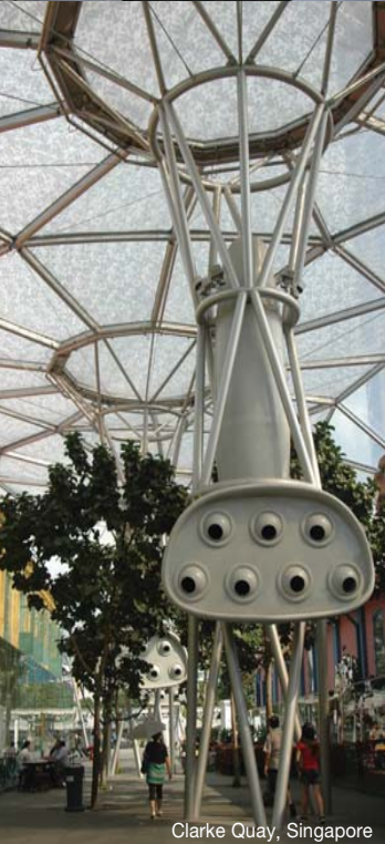
Clarke Quay, Singapore