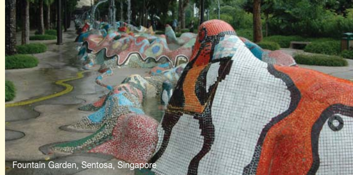
Fountain Garden, Sentosa, Singapore